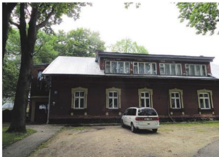
Valga koguduse kirikumõisas tegutsev MTÜ Domus Petri Kook pakub lõunasööki väikese sissetulekuga eakatele ja puudega inimestele, vähekindlustatud perede lastele ja töötutele.

Kahjuks või pigemini siiski õnneks aasta-aastalt supiköögi klientide arv väheneb. «Kas see on seotud rahva elatustaseme tõusuga või mitte, ei oska ma öelda. Küll võin kinnitada, et teenus on endiselt nõutud ja vajalik, eriti lastele, kel nii mõnelgi jääb see ainukeks soojaks söögiks päevas.»